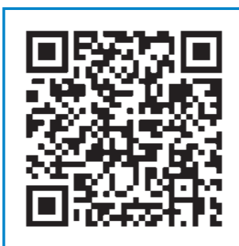
Resumo Filmoteca de Galicia

No marco do Día Internacional dos Arquivos Fílmicos, en outubro, exhibíronse películas que xiran ao redor do importante labor destas entidades, incluíndo unha homenaxe especial ao Oleksandr Dovzhenko National Centre de Kíiv, o principal arquivo fílmico de Ucraína. A carteleira da Filmoteca completouse