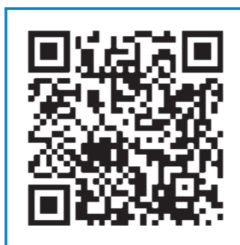
Ás oito da tarde, cando morren as nais